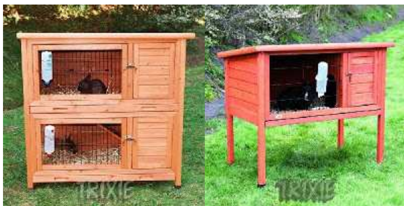
Σπιτάκια κουνελιών σε μέγεθος κατάλληλο και για μπαλκόνι