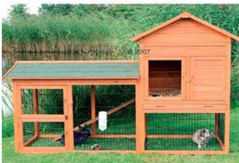
Σπίτι κουνελιών για τον κήπο